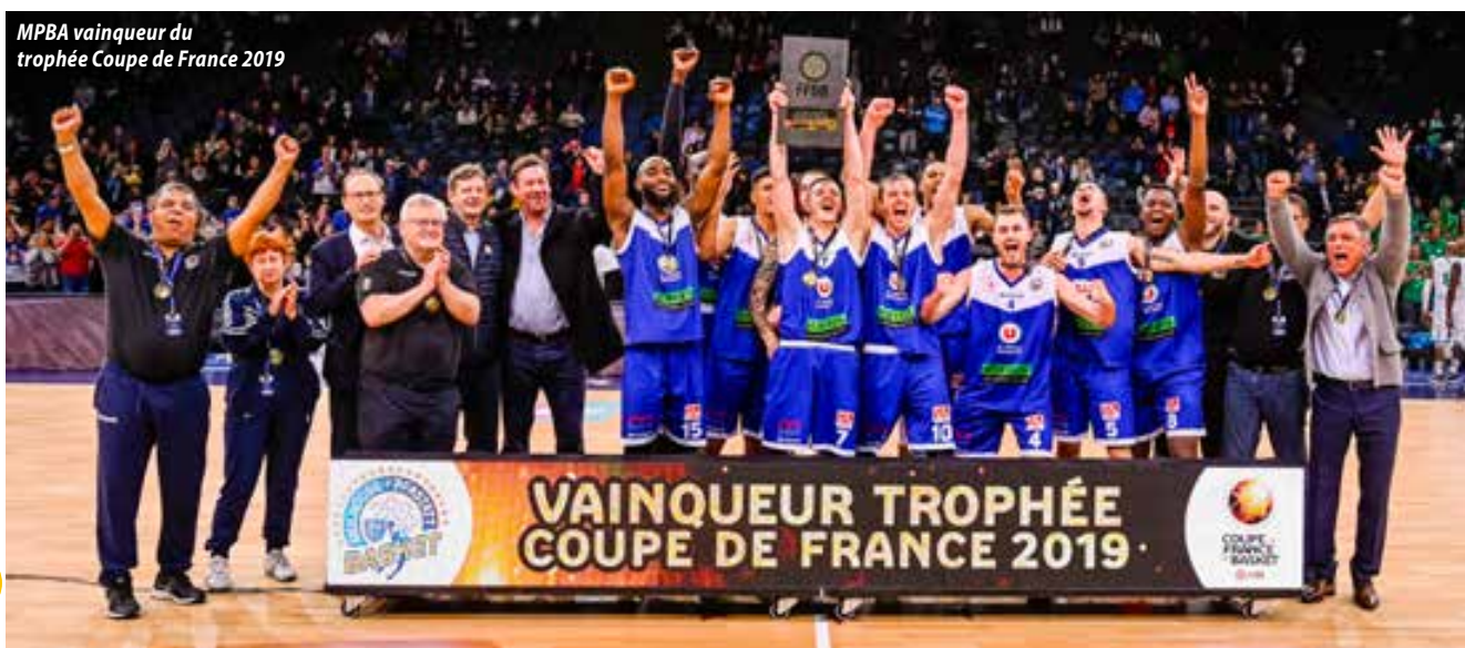
MPBA vainqueur du trophée Coupe de France 2019