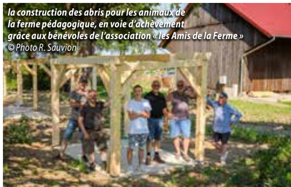
la construction des abris pour les animaux de la ferme pédagogique, en voie d'achèvement grâce aux bénévoles de l'association « les Amis de la Ferme »

Très critiquée à l'origine, la Cotonnade jouit aujourd'hui d'un d'habitat de qualité, de logements privatifs et sociaux exemplaires, le tout dans un espace arboré. Questionnez les habitants, ils vous diront leur joie de vivre à Pfastatt.