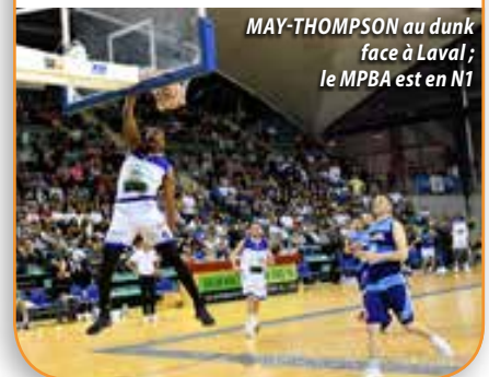
MAY-THOMPSON au dunk face à Laval ; le MPBA est en N1