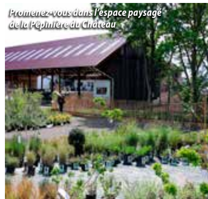
Promenez-vous dans l'espace paysagé de la Pépinière du Château