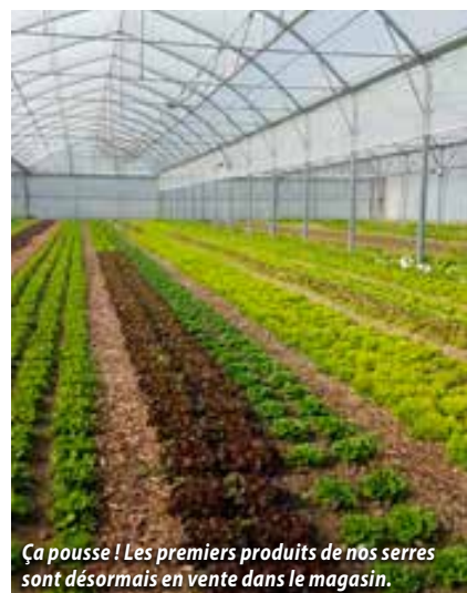
Ça pousse ! Les premiers produits de nos serres sont désormais en vente dans le magasin.

Pour cette nouvelle édition du bulletin municipal, outre un petit tour d'horizon de la ferme, nous vous proposons de faire connaissance avec ses exploitants... sans oublier les nouvelles fraîches de notre future mini-ferme !