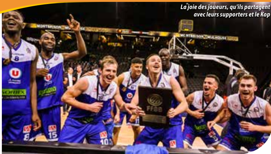
La joie des joueurs, qu'ils partagent avec leurs supporters et le Kop

suspense. Si le début de match est à l'avantage des Foréziens, les « bleus » ne tardent pas à hausser le ton : jusqu'à la mi-temps où les deux formations se quittent sur une égalité parfaite (40-40). De retour sur le parquet, les deux équipes se rendent coup pour coup si bien qu'elles n'arrivent à se départager qu'au bout de la deuxième prolongation, dominée par des Alsaciens plus frais physiquement et qui offrent finalement le Trophée 2019 au MPBA, sur le score de 82-93 après prolongation.