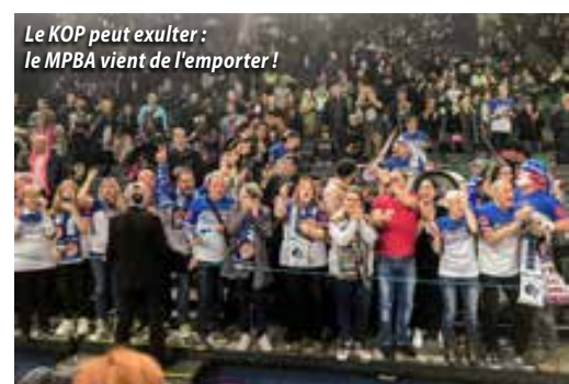
Le KOP peut exulter : le MPBA vient de l'emporter !