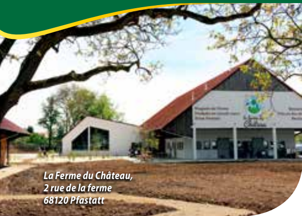
La Ferme du Château, 2 rue de la ferme 68120 Pfstatt