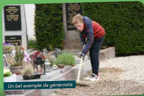
Un bel exemple de générosité