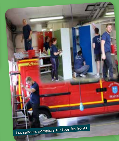
Les sapeurs pompiers sur tous les fronts