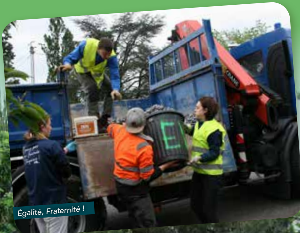
Égalité, Fraternité !