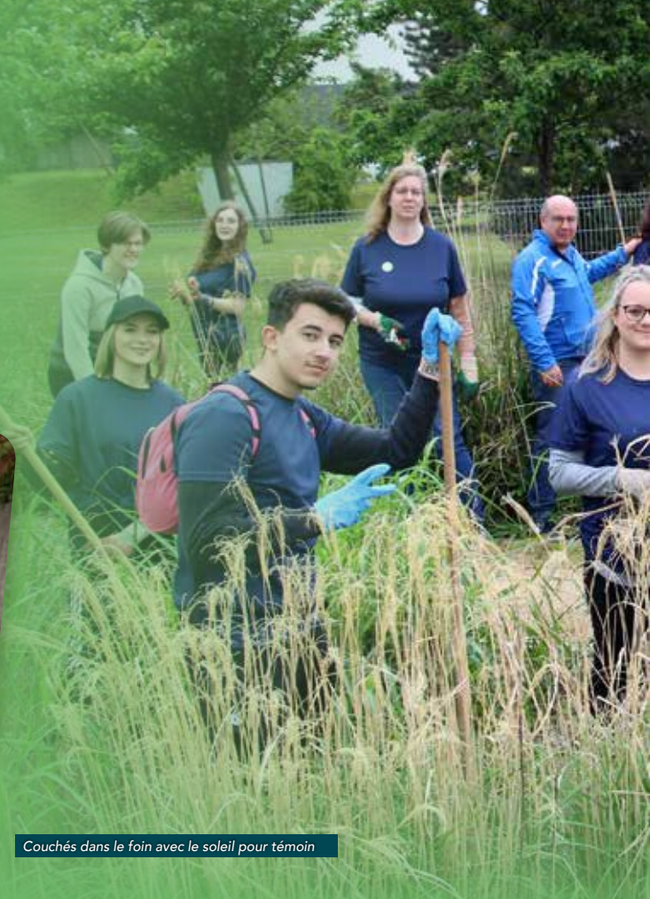
Couchés dans le foin avec le soleil pour témoin

Un bataillon en camionnette circulait toute la matinée aux différents « check-points » pour apporter le café, les croissants et l'eau pendant qu'une bri-