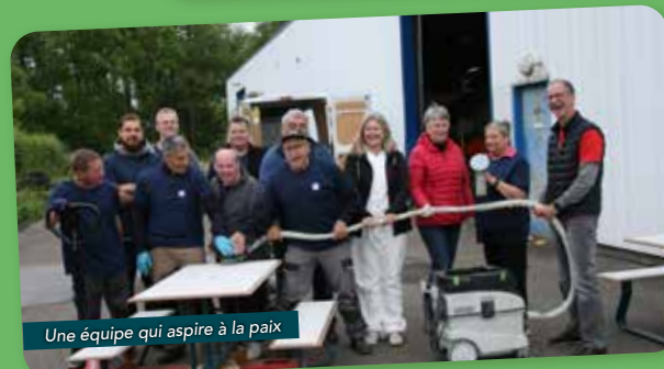
Une équipe qui aspire à la paix