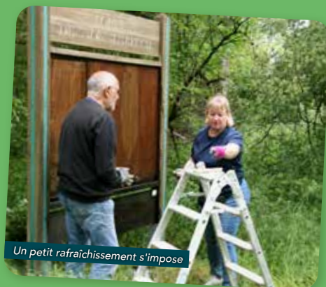
Un petit rafraîchissement s'impose