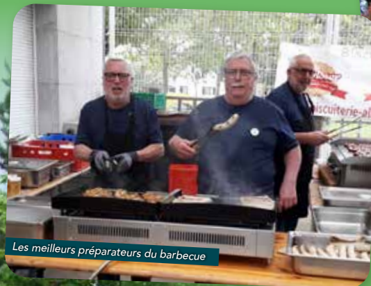
Les meilleurs préparateurs du barbecue