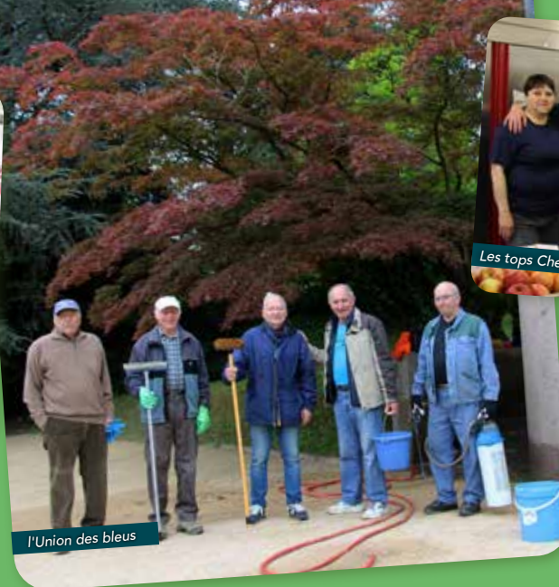
l'Union des bleus