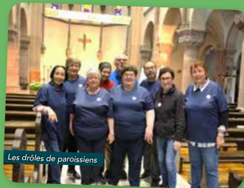
Les drôles de paroissiens