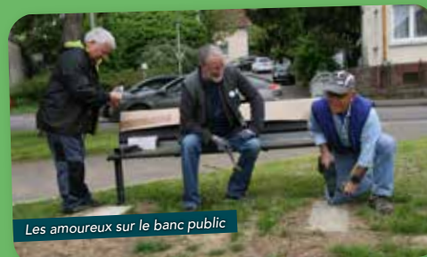
Les amoureux sur le banc public