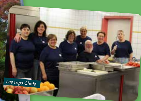
Les tops Chefs