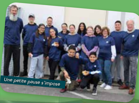
Une petite pause s'impose