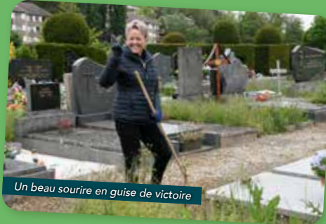
Un beau sourire en guise de victoire