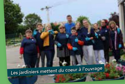
Les jardiniers mettent du coeur à l'ouvrage