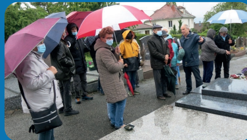
Un évènement national qui avait eu du succès en 2021 et qui sera renouvelé

Dans le cadre de l'évènement national «Le Printemps des cimetières», la commission Patrimoine du conseil municipal organise à nouveau, avec le concours de la Société d'Histoire et de Généalogie de Pfastatt, deux visites guidées gratuites et, nouveauté cette année, une conférence.