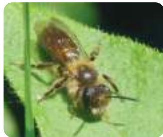
À gauche : Abeille charpentière À droite : Abeille verte-andrène de la bryone

Ses consœurs sauvages, moins connues, comme le bourdon terrestre, l'abeille charpentière, l'osmie, la collète ou l'andrène commencent à polliniser les fleurs dès que la température atteint 4°C, ce qui est fort utile lorsque le printemps est frais comme en 2021. On estime alors que les abeilles sauvages font 90 % du travail !