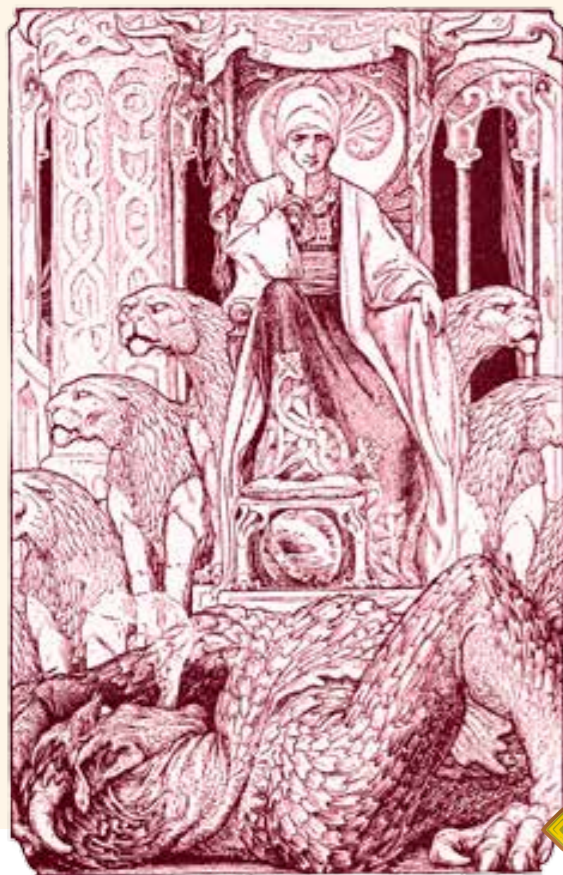
KING SOLOMON AND THE REBELLIOUS GENIE