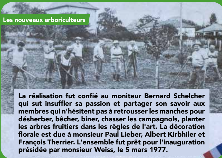
Les nouveaux arboriculteurs