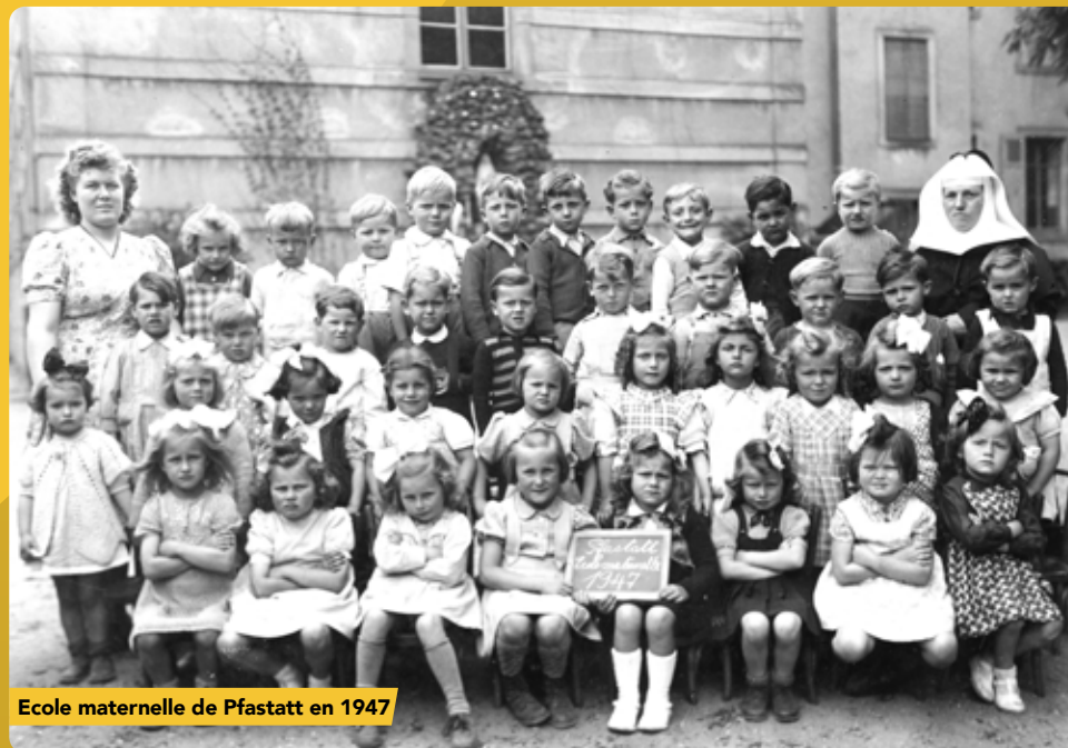
Ecole maternelle de Pfastatt en 1947