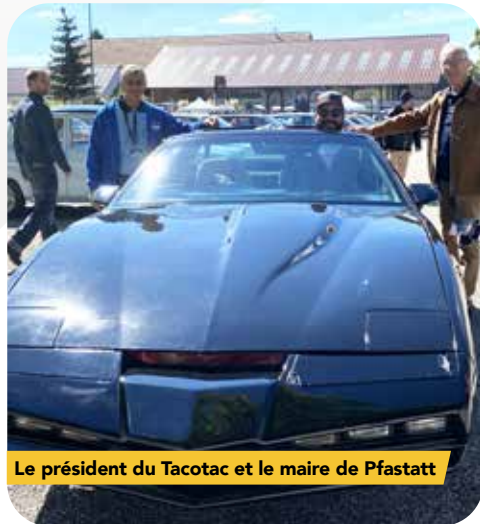
Le président du Tacotac et le maire de Pfastatt

Dimanche 15 septembre, à la ferme du château, les pfastattois venus nombreux ont fait un voyage dans le temps « An appointment at the farm* »