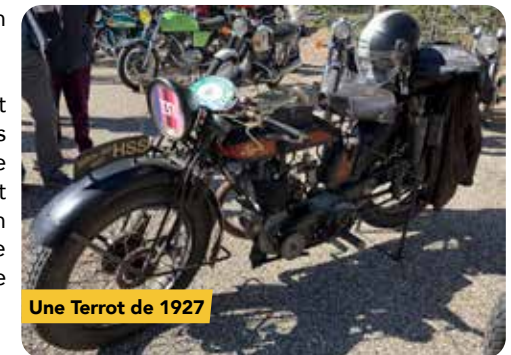
Une Terrot de 1927