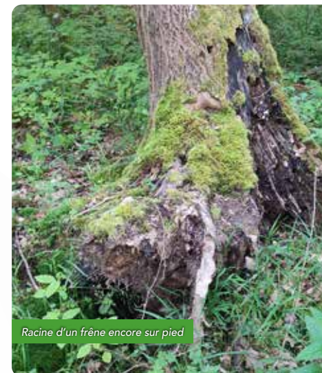
Racine d'un frêne encore sur pied