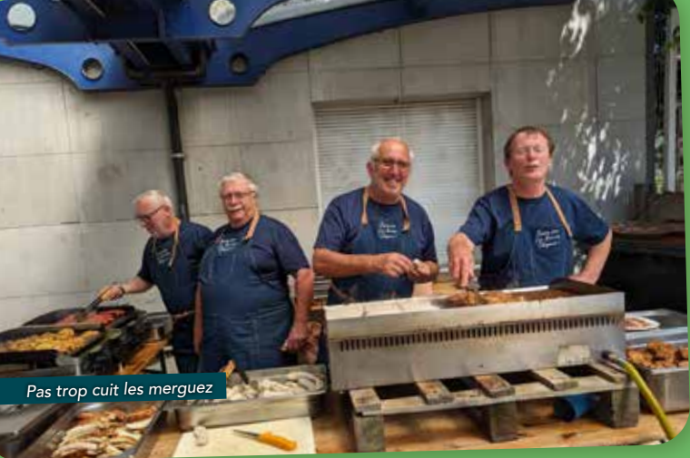
Pas trop cuit les merguez