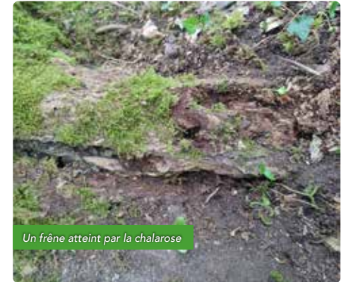
Un frêne atteint par la chararose