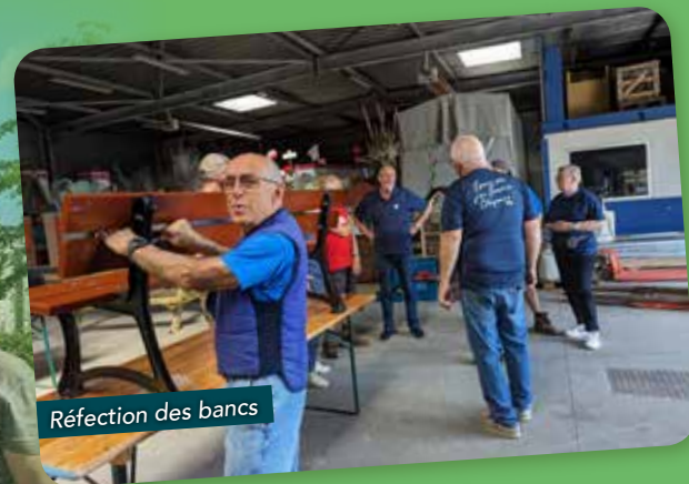
Réfection des bancs