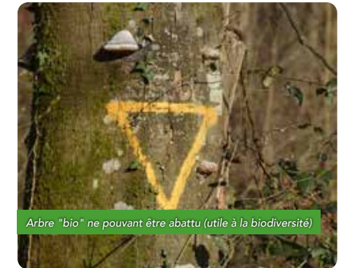
Arbre "bio" ne pouvant être abattu (utile à la biodiversité)