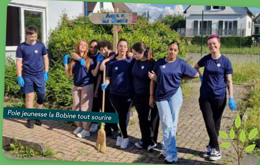
Pole jeunesse la Bobine tout sourire