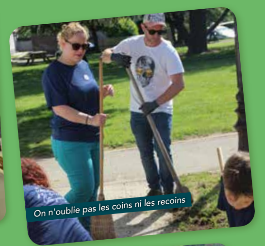
On n'oublie pas les coins ni les recoins