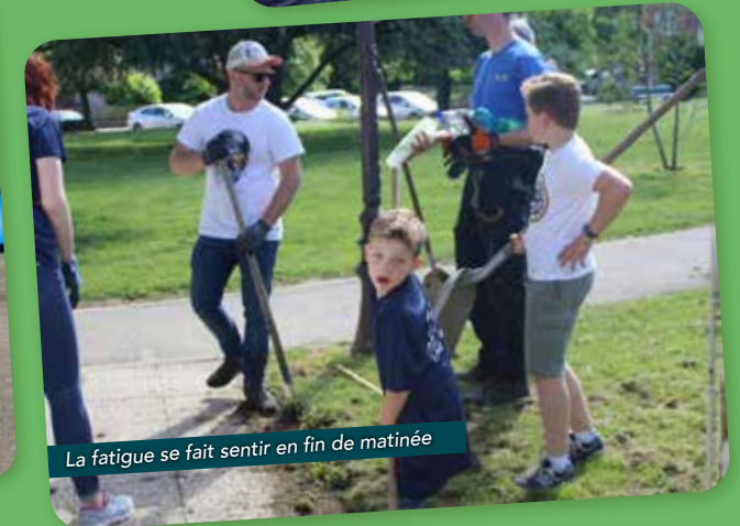
La fatigue se fait sentir en fin de matinée