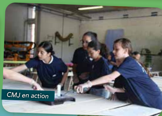
CMJ en action