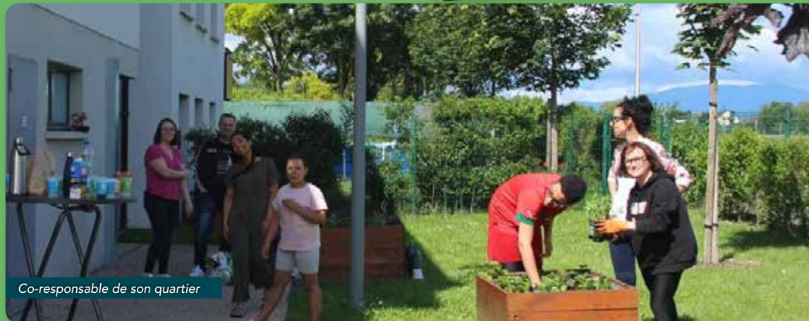
Co-responsable de son quartier