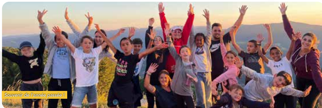
Souvenir de l'année passée !

Les jeunes porteurs de ce projet et participants à ce séjour ont pu voir comment monter une organisation d'une telle envergure en combinant les efforts et l'histoire des Jeux Olympiques en France.