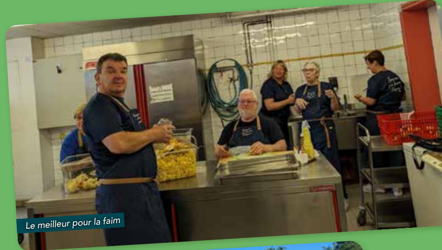
Le meilleur pour la faim