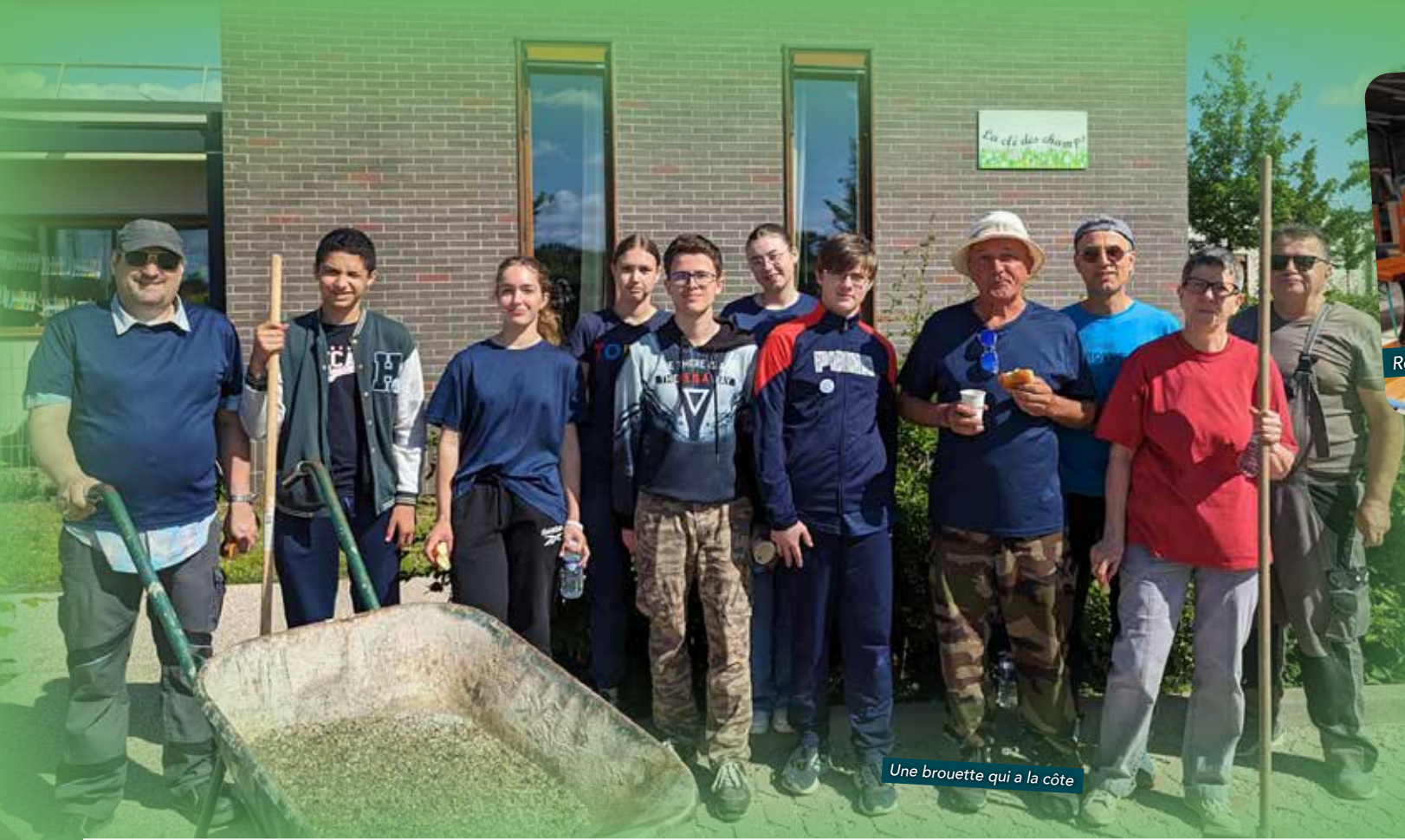
Une brouette qui a la côte